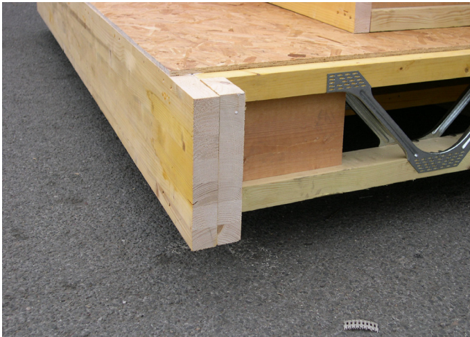
3 | Beim abgebildeten vorgefertigten Deckenelement wird auch die Ausbildung der Verblockung der Deckenscheibe und Kippstabilisierung der Träger am Auflager deutlich.

duellen Anforderungen reagiert werden. Möglich sind zum Beispiel: aufliegender Untergurt, hängend an auskragendem Obergurt, in Balkenschuh, auf Streichbalken u.a.m.