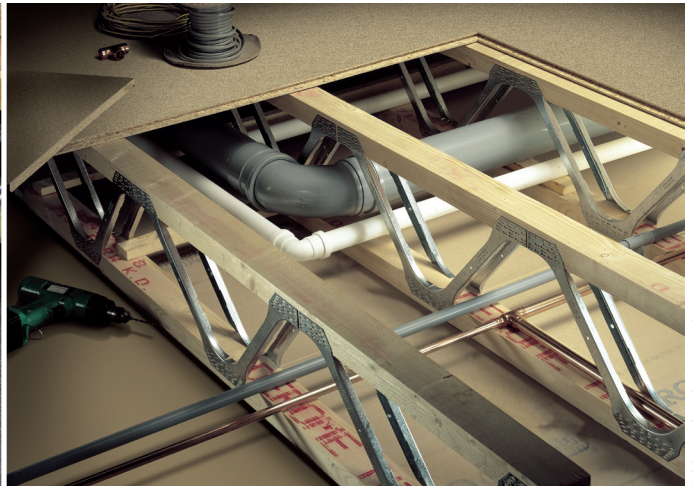
5 | Zwischen den Gurten der Träger verbleibt eine zweidimensional nutzbare Installationsebene, die sich zur Verlegung gebäudetechnischer Versorgungsleitungen anbietet und außerdem gedämmt werden kann. Die Parallelträgerkonstruktion kann auch als Verlorene Schalung dienen.

Untergurt befestigt werden, soweit das vorgegebene Verlegeraster der Träger mit der Plattengröße der Untersicht in Einklang steht.