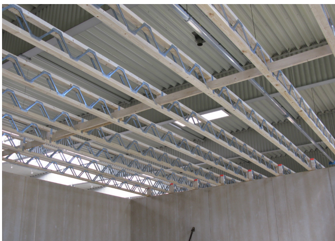
4 | Mit Kippsicherung: Open-Web-Joist-Decke mit Kippriegel, der quer zur Spannrichtung der Träger eingeschoben ist.